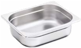
POJEMNIK GN 1/2, STANDARD