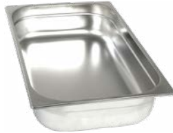
POJEMNIK GN 1/1, BASIC