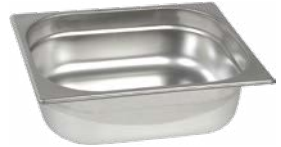
POJEMNIK GN 1/2, BASIC