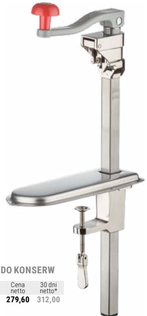
OTWIERACZ DO KONSERW